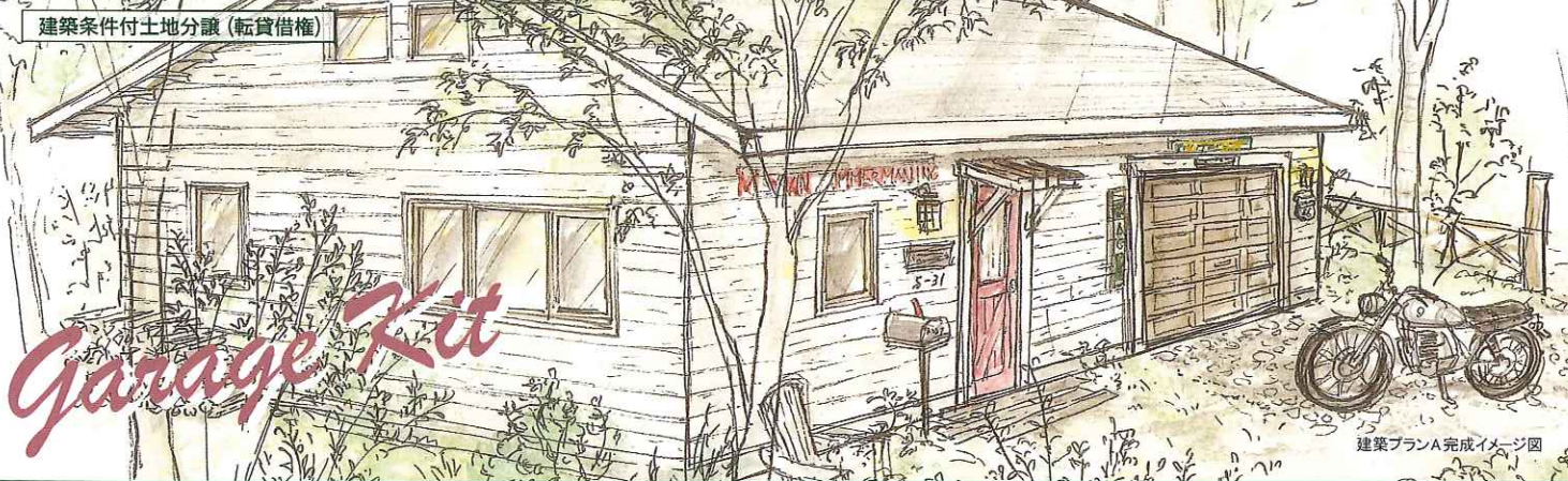
建築プランA完成イメージ図