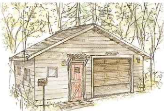
建築プランB完成イメージ図