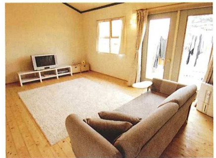
無垢材と白を基調とした明るいリビング

壁周り:ウエスタンレッドシダー、ベベルサイディング・ウエスタンレッドシダー 床周り:一部床材にレッドパイン材 屋根周り: その他:塗料 大谷塗料/ハトン 延べ床面積:168.93㎡ [1階=86.12㎡、2階=82.81㎡]