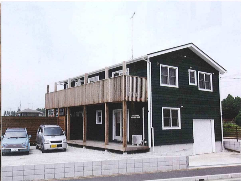
グリーン色の外壁がノスタルジックな佇まいの家

施主が以前、建築関係に従事していたこともあり、基礎工事からすべてセルフビルドで建てられた事例。外壁はレッドシダーのサイディングで、内側はエコボードを採用。ただ住宅兼オフィス（キットガレージの販売施工と自動車売買）として使用するため、屋根にはSIPSパネル、壁は木質系天然素材の外断熱材を使用するなど、外壁の味わい深い色合いが醸し出すノスタルジックなたたずまいとは裏腹に、機能的には新しい試みがなされている。 1階はガレージと会社事務所、そしてダイニング。2階は子ども部屋と寝室になっている。