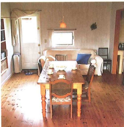
天然木と白い壁のコントラストが美しい