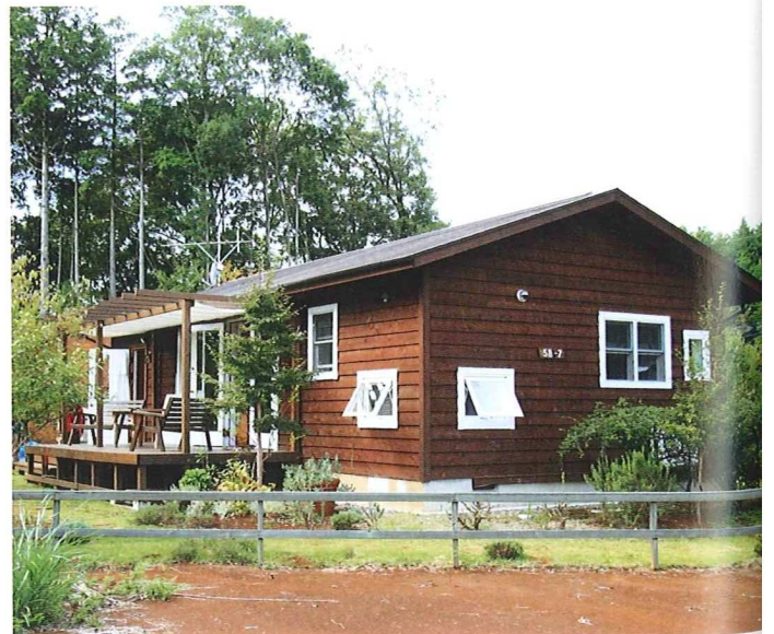
豊かな自然の中にある暮らしやすい平家建て

ダークブラウンに塗られたシックな平家建てのガレージを元にした家。横には、シダーガレージを物置兼趣味の部屋として建設。そもそもオーナーが高台からの眺めの良さと手つかずの自然にひかれこの土地に家を建てることを決心しただけであり、林野の景色と違和感なく解け合っている。 内装は床、壁、天井にパイン材を使用し、壁や建具を白く塗装することで、すっきりとした印象を与えることに成功した。 野菜やハーブの植えられた菜園があり、オープンデッキからは四季折々の自然が、野鳥のさえずりをBGMに楽しめるという。